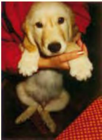
Goldie剛抱回家時，只有一個月大，性格內向，整天都躲在椅子下。

有關狗的書籍作品，總帶有一抹傷感的色彩。像日本導盲犬可魯與嬌娜的故事，牠們善良、聰明、忠誠，但最後都無可奈何地離開了主人。